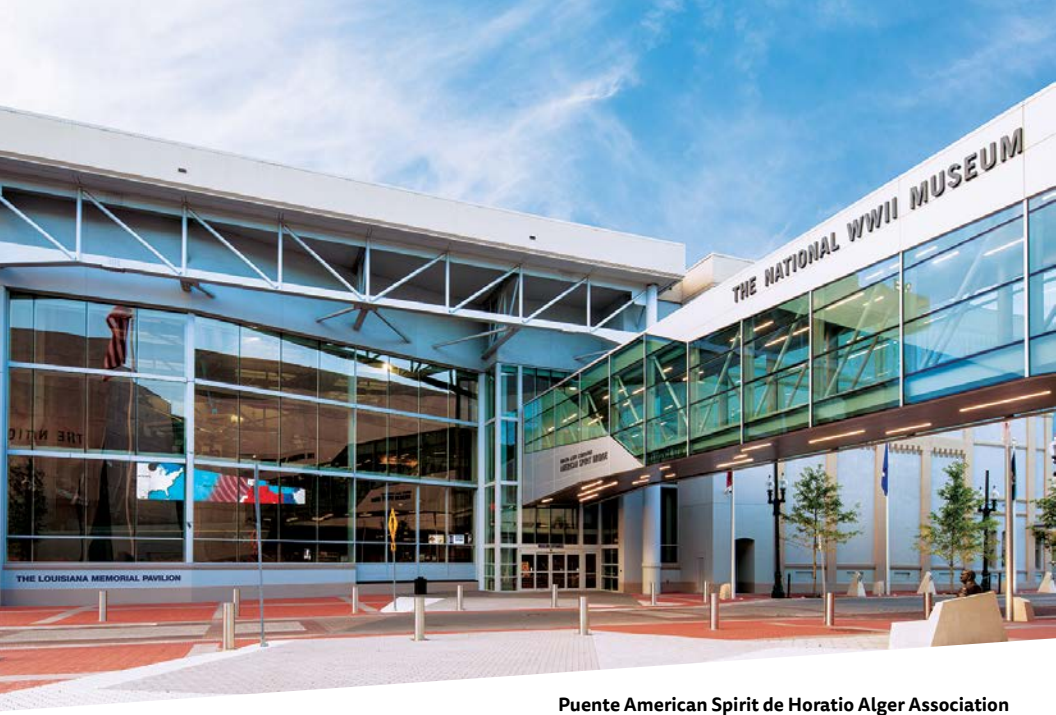
Puente American Spirit de Horatio Alger Association