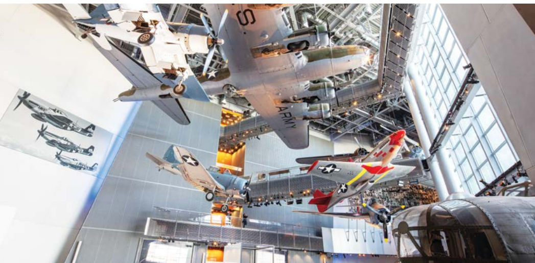
Galería de aviación George H. W. Bush

WWII THE NATIONAL WWII MUSEUM NEW ORLEANS