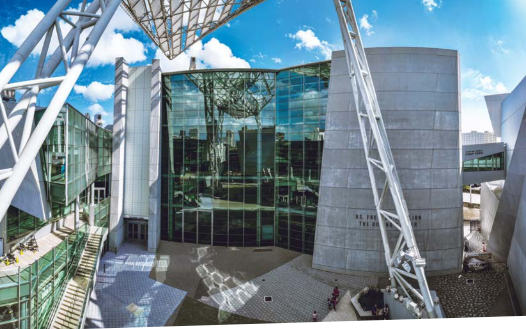
Plaza de armas Col. Battle Barksdale